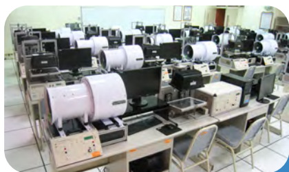
綠能科技與智慧節能展示中心

輔導七張熱門就業執照。透過實務專題製作，將理論與實務結合，達到「學以致用」的教學目標。