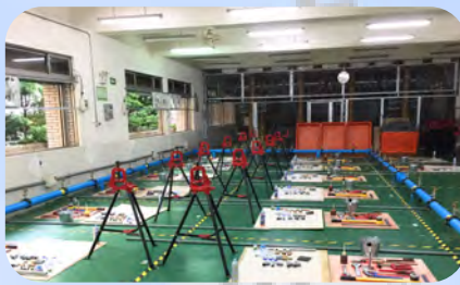
乙級自來水配管檢定場地