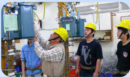
乙級室內配線檢定場