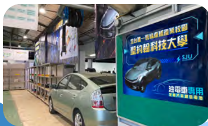
儲能電池檢測再生中心