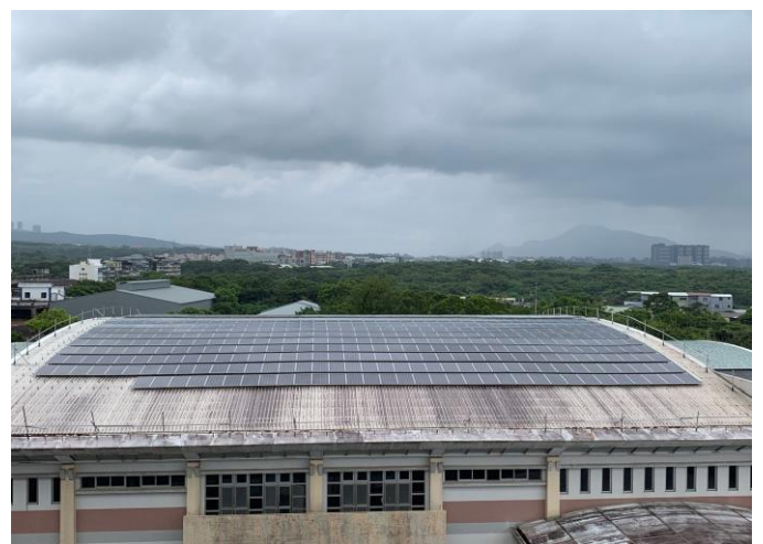
百齡堂屋頂鋪設太陽能板，不但可以改善屋頂防水功能，綠能屋頂亦呈現嶄新風貌。