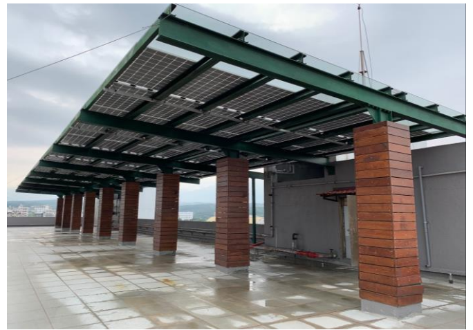
聖約翰科大於工管大樓新埔共創基地自設屋頂景觀型太陽光電發電設備，設置容量為 40.6 瓩。