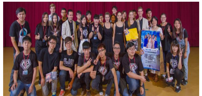
2015 年 10 月 29 日來自匈牙利的 Jazzation 樂團，帶給大家美妙的混聲爵士阿卡貝拉體驗。