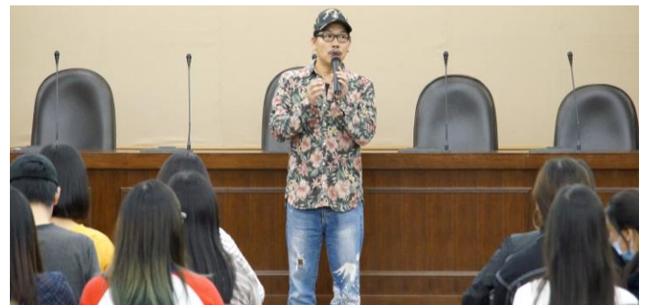
2018 年 10 月 3 日邀請知名作詞人方文山蒞校進行文化沙龍演講，講述如何「當一個有故事可以說的人」。