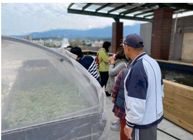
「太陽能空中花園與無毒魚菜共生系統」即將落成啟用，吸引樂齡大學學員前往參觀。