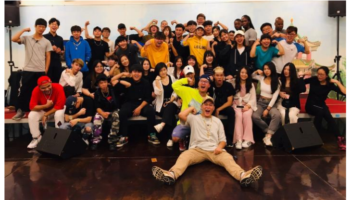
2019 年 9 月錄製音樂社結合 SJM 調酒社，現場有加勒比海地區友邦技職訓青年、港澳、馬來西亞、本校同學參與，熱鬧非凡。