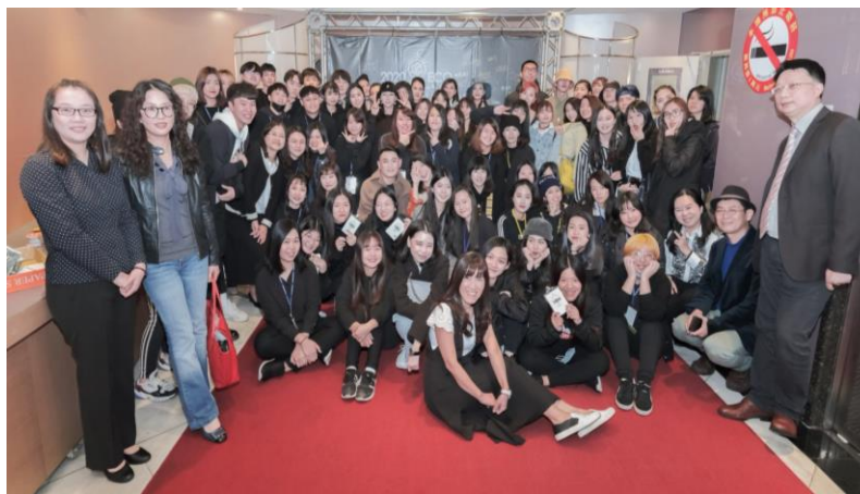
聖約翰科大時尚系每年都會舉辦一次動態展，由學生主導、老師指導，從企劃提案、合作對象洽談到活動籌劃均由學生一手包辦。