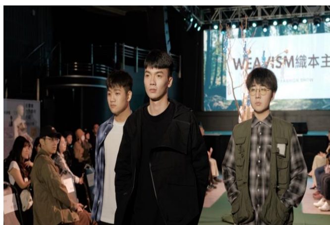
WEAVISM 織本主義以奈米技術將魚鱗中的膠原蛋白胜肽纖維注入紡織纖維中，環保材質可自然分解於大自然中，兼具環保永續及機能特性。