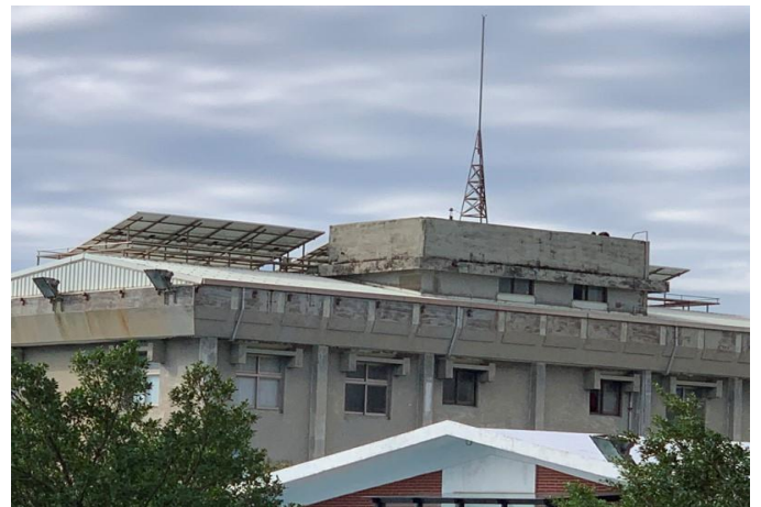
電機系於卓民樓屋頂自設太陽能板，設置容量為 9 瓩。