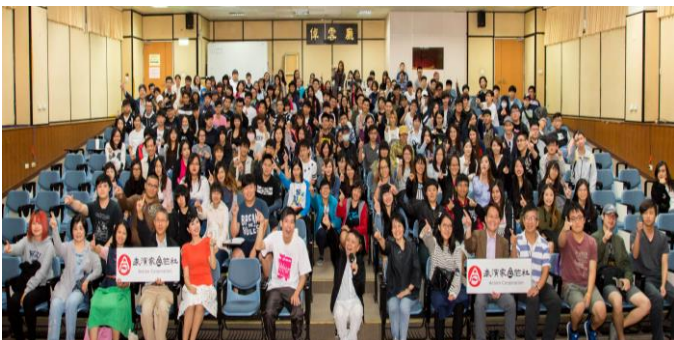
2017 年 10 月 26 日何兆豐數位藝文中心，邀請「表演家合作社」劇團蒞校演出三段小品故事，現場座無虛席。