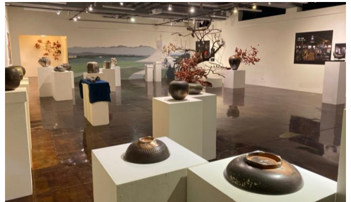
2019 年 10 月 23 日至 12 月 6 日舉辦「火的纏綿--台灣柴燒窯行脚紀實創作聯展」。