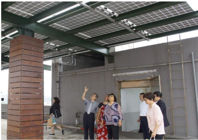
聖約翰科技大學是全台最大設置太陽光電發電設備的學校，在太陽光電及新能源領域的豐碩成就，吸引邦交國大使參訪取經。