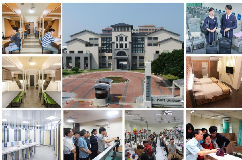
風華五一，聖約翰科大積極建設、營造特色

基於對母校深厚的情誼，校友對學校的經營發展非常關心，也提供最大的支持與幫助。例如：學校與校友會合作舉辦「百家校友企業站出來」、「名師出高徒--百位跨國跨界跨校系業師團」活動，優先提供母校畢業的學弟妹們實習或就業之機會，就是校友直接回饋母校最好的例子。校友對母校向心力強，且熱心奉獻、回饋母校，特別重視傳承及人才培育精神，學長們肩負起提攜後進、經驗傳承的使命，龐大且綿密的校友網絡，遂成為母校學弟妹未來實習與就業最珍貴的「人脈資產」。「校友企業，保證就業」、「選擇聖約翰科大，明日進百大」，這是以「校友建校」為特色的聖約翰科大所獨有的優勢與資源。