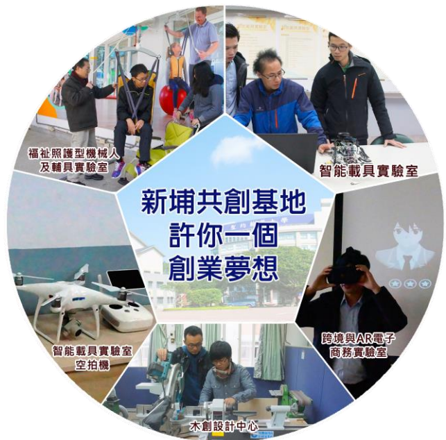
聖約翰科大啟動共創基地，成就創業夢想

面對未來全球化的世界潮流，聖約翰科大正朝向培育擁有多重技能、具跨領域與跨產業的人才作定位。憑藉工科起家的既有優勢資源，以三共三創的理念，設置「新埔共創基地」，初期先建置出「智能載具」、「無線感測」、「時尚機能元素交易所」、「跨境與 AR 電子商務」、「木創設計」與「福祉照護型機械人及輔具」等 6 個特色實驗室，提供師生團隊創意交流場域與創客空間，發揮技職教育實作優勢，並結合新埔校友企業資源，讓有理想、有抱負的學生可以將在校所學接軌產業，成就創業的夢想。