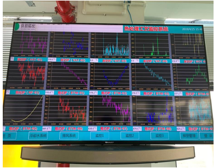
生產廠房：嚴格抽樣檢測，確保熱處理品質。