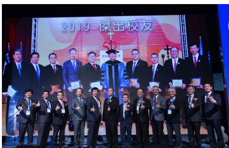
今年度的傑出校友熱情參與，為年會增添光彩。

2019 校友年會尚有許多亮點，除了全體理監事提供的摸彩禮品，最大獎是校友總會提供的 3 台 i Pad；現場也進行校園相片義賣活動，所得款將會用來贊助母校清寒學生的愛心餐券經費，獲得校友熱情響應，八幅作品銷售一空，實踐母校「用生命影響生命」的良善精神。（撰稿：游承桓）