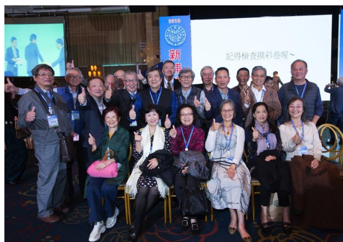
第一屆學長攜伴一同參與校友慶祝大會留下美好回憶。