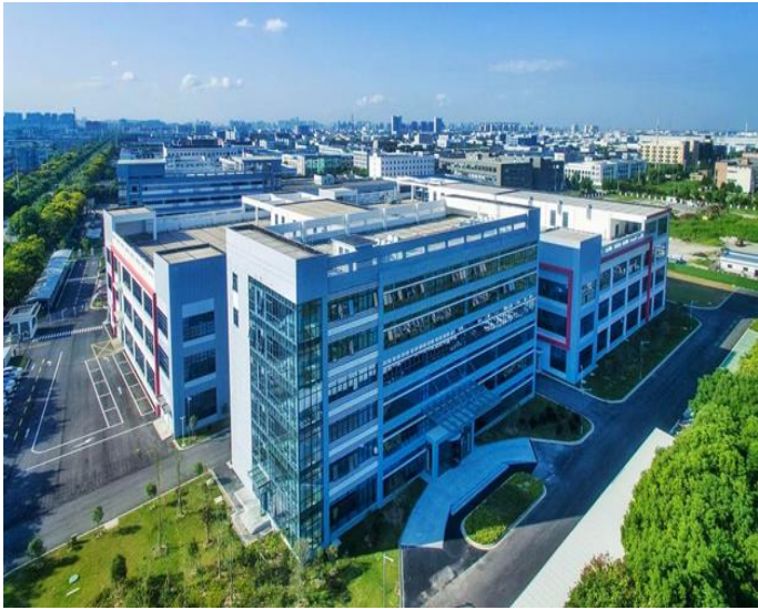
優德精密工業(昆山)股份有限公司。

是在台灣、在海外、在不同專業領域中，皆能持續的發光發熱、領先群倫。(撰稿、相片提供：企業管理系羅玟甄主任)