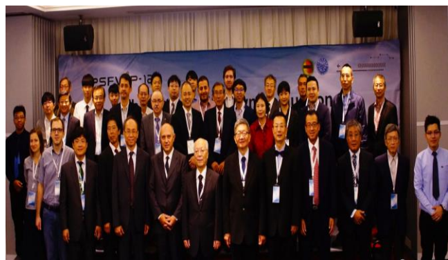
聖約翰科大主辦「第 12 屆太平洋流場可視化及影像處理國際會議」促成全球科技合作的橋樑。