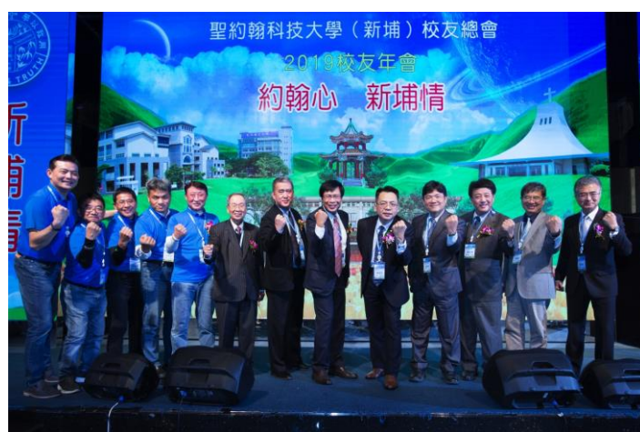
海內外各地校友會齊聚一堂，同賀母校茁壯發展。