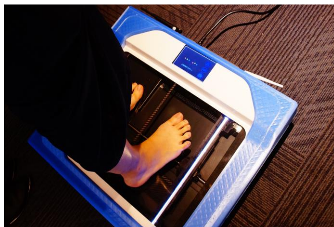
精準量測腳底熱流，客製化屬於自己的健康產品。