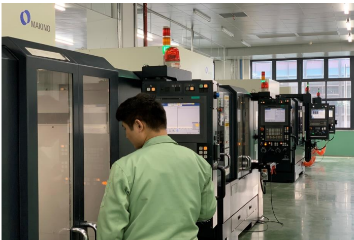
生產廠房：精密恒溫車間、能耗管理系統、智慧管理系統及顯示看板。