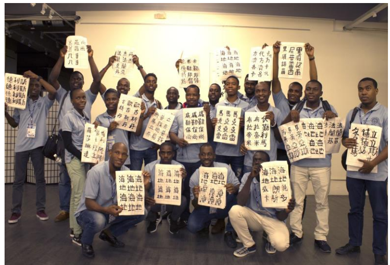
海地學員書法體驗課程。