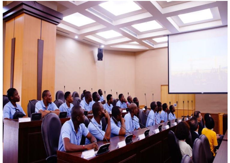
來自海地的 20 位學員於開訓典禮上專心觀看國會服務友邦的宣傳影片。