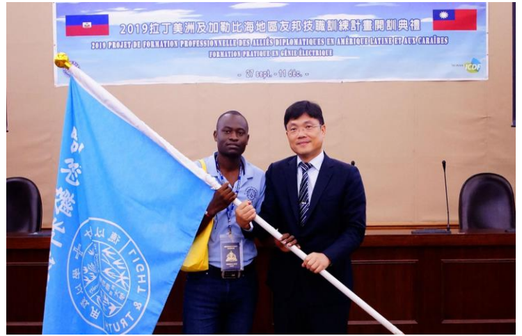
艾和昌校長(右)授旗給海地學員(左)。