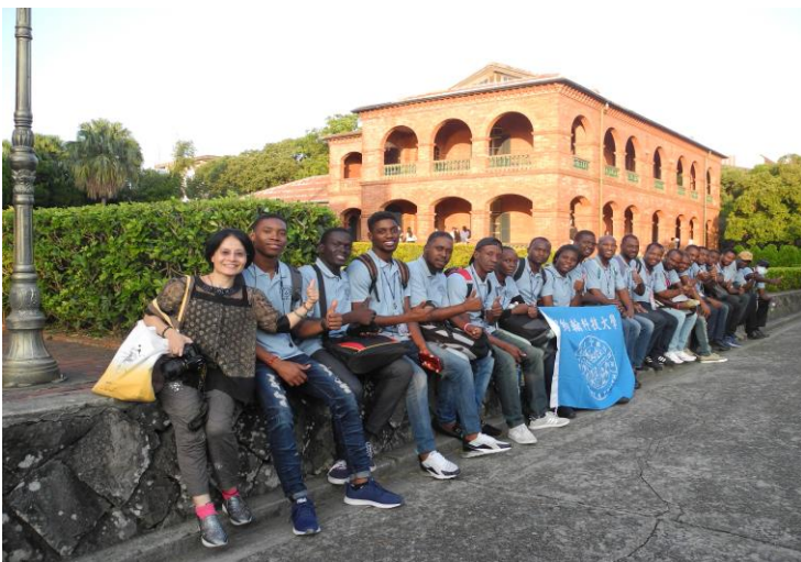
海地學員參訪淡水紅毛城中文課戶外進行式。