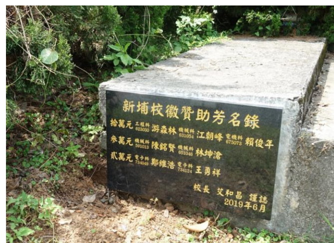
新埔校徽贊助芳名