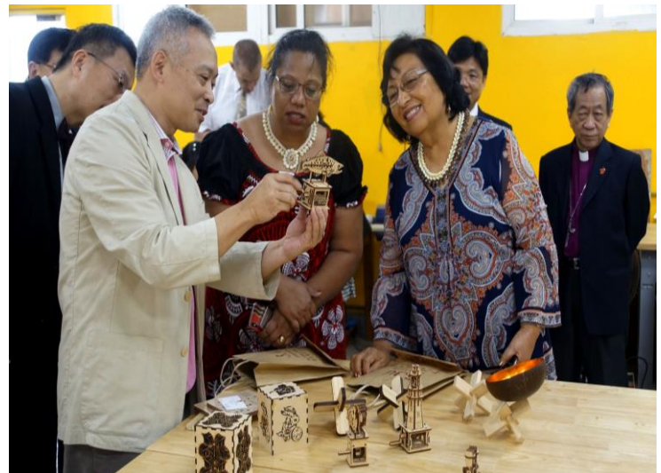
馬紹爾群島共和國艾芮瓊大使及吉里巴斯共和國藍黛西大使參觀木創設計中心，對木創中心的木製作品表現極高興趣。