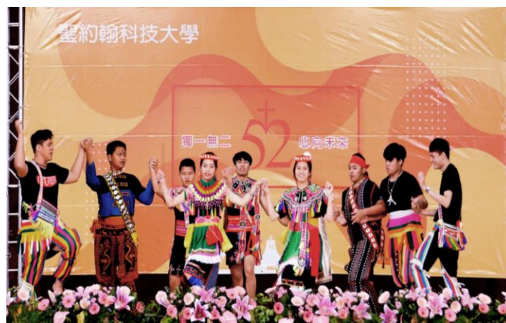
原創文化社帶來精彩的原住民族傳統舞蹈表演，炒熱現場氣氛。