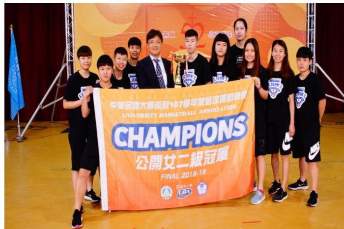
聖約翰女籃隊勇奪 107 學年度富邦人壽 UBA 大專籃球聯賽公開女二級冠軍，特別將獎座獻給學校，以感謝全校師生及校友學長們的支持與鼓勵。