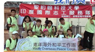
來自商管及民設學院的蒲公英國際志工團遠赴印度及緬甸傳遞溫暖