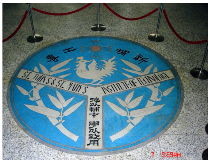
1965 年新埔工專創校時，鑲嵌於聖公樓一樓的校徽，是新埔人的精神堡壘，也是所有校友的共同回憶。