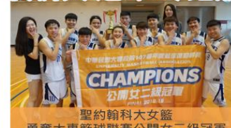
聖約翰科大女篮 勇奪大專籃球聯賽公開女二級冠軍