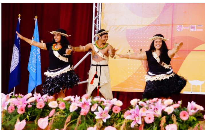
吉里巴斯共和國在台學生帶來國家的傳統舞蹈，展現多元文化交流的特色。