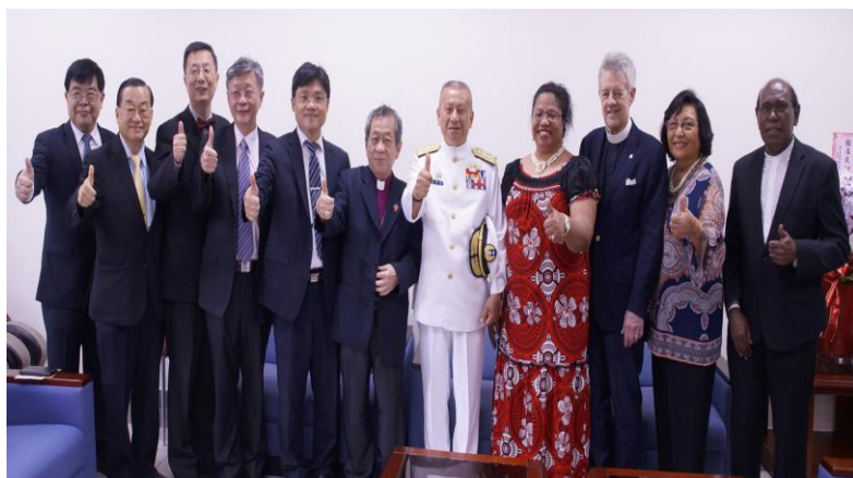
聖約翰科大喜迎 52 週年校慶，3 個邦交國大使及聖公會貴賓出席盛會，現場嘉賓雲集。

聖約翰科技大學 108 年 4 月 27 日以「獨一無二、心向未來」為主題，歡慶在台創校 52 週年，這也是該校有史以來，第一次有 3 個邦交國大使及聖公會貴賓出席盛會，現場嘉賓雲集。該校以太陽光電應用科技及新能源工程領域的實力，吸引索羅門群島、吉里巴斯共和國及馬紹爾群島等邦交國前來該校參觀相關設施，開啟合作夥伴關係。3 國大使除聯袂出席校慶大會、參觀校內特色中心外，更參與該校「新埔共創基地」的揭牌啟用儀式，對聖約翰科大透過跨域學習、跨界育才的方式，催化師生創業夢想，表達肯定與讚賞。