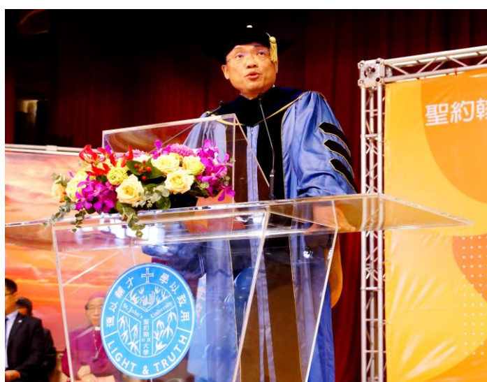
聖約翰科大艾和昌校長鼓勵同學勇敢築夢，學校會幫助有意願挑戰自我的學子，找到充滿無限可能的人生價值。

第 2 次在母校參加畢業典禮並擔任貴賓致詞的高雄科大楊慶煜校長說，新埔工專 5 年，培養他獨立思考的能力，特別感謝聖約翰師長的栽培與教導。他以「少小離家老大回」及「青出於藍而勝於藍」兩段生命故事幽默開場，並以「這是水」的小故事與學弟妹分享，平淡無奇又十分重要的事充斥於生活中，要如何在日復一日的成人世界裡保持意識清醒而鮮活，是很重要的事。求知慾旺盛、很愛追根究底的他，以賈伯斯的名言「求知若渴 Stay hungry、虛心若愚 Stay foolish」勉勵學子永續學習，持之以恆，與時俱進。並且找到一個自己熱愛的工作，用盡時間、精力跟熱忱，才能維繫長久的熱情。除此之外，面對挫折困難千萬別太快放棄，要勇敢經歷這一切，並從失敗中學習，讓逆境成為人生的養分。同時也要秉持人本關懷的精神，成為給予別人溫暖的人，在心中永遠保有一塊「能看見他人苦難」的溫柔角落。