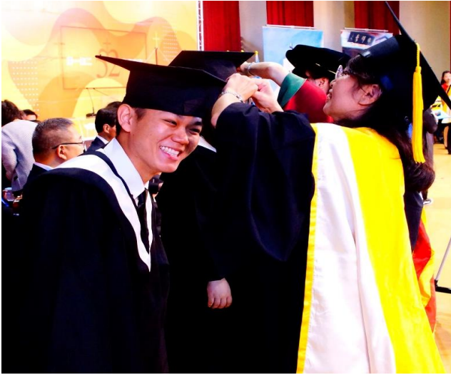
師長們在舞台上逐一為畢業生進行撥穗及授證儀式，為畢業生留下難忘回憶。