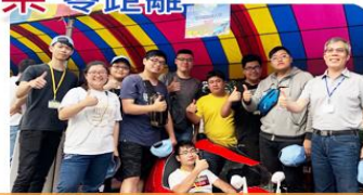
機械系學生親手打造電動車