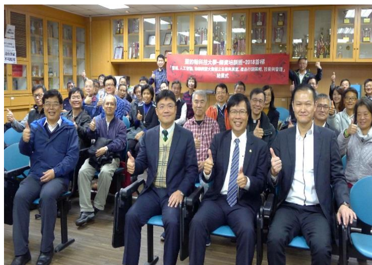
聖約翰科技大學開設「雲端、人工智慧、物聯網暨大數據」師資培訓班培育 AI 師資，迎戰人工智慧浪潮不缺席。

積極鼓勵教師與 Intel、Google、微軟及 IBM 等國際知名大廠，產學合作執行專題外，2018 年 3 月已開設「雲端、人工智慧、物聯網暨大數據」師資培訓班，延聘國際大廠一流業界專家授課，首梯隊計有 35 位種子教師完成培訓。包括工商民生設計等學院及通識教育老師，未來都具備教授「人工智慧」課程的能力，無論是課程教學、計畫研究或專題指導，都能提供學生不同領域的專業師資，幫助學生深度學習「人工智慧」應用智能向下扎根，厚植學生不被取代的職場實戰力。