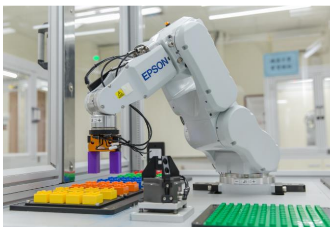
工管系建置機器視覺之六軸機器手臂，讓學生了解機器手臂的構造與用途。

艾和昌校長指出，學校憑藉工科起家的既有優勢資源，鼓勵年輕學子共有、共享、共好以及創新、創意、創業的理念，設置新埔共創基地，並以「綠能、智慧、健康」之特色，建置出智能載具、無線感測、時尚機能元素交易所、跨境與 AR 電子商務、木創設計與福祉照護型機械人及輔具等 6 個特色實驗室，提供師生團隊創意交流場域與創客空間，發揮技職教育實作優勢。非常感謝 YANG'S INTERNATIONAL TRADING,LTD 捐款新台幣 100 萬元挹注新埔共創基地發展基金，學校將妥善運用校友捐款，並結合新埔校友企業資源，讓有理想、有抱負的學生可以將在校所學接軌產業，成就創業圓夢的夢想。( 撰稿：公關組王玉如、相片：艾和昌校長、工管系黃國男主任提供 )