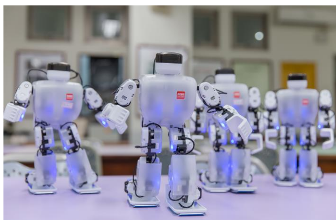
工管系引入藍芽機器人教學模組，藉由一系列課程與實作模擬，學生可透過『做中學』學習最新科技與技術，進而邁向智慧生產之領域。