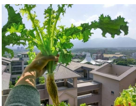
專業教室小型魚菜系統種出來的菊苣，不添加任何農藥或化學肥料，對人類健康有益