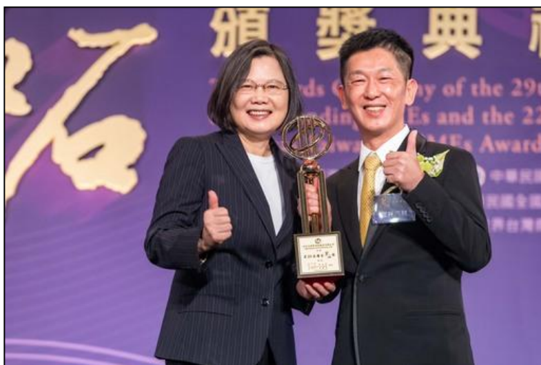
蔡英文總統(左)親自頒獎表揚，肯定世祥汽材成為全球汽車配件領導廠之卓越貢獻。

曾鴻鍊理事長指出，聖約翰科大以工科起家，校友遍布各產業，在汽車體系內，新埔及聖約翰校友更是不計其數。校友總會目前正積極建置校友合作平台，整合所有從事汽車零組件行業的校友企業，變成獨特的「校友經濟體」。運用校內師資、場地設備及校友企業的資源，秉持「一個團隊、一家人」的理念，積極參與科技部或教育部等政府機關的計畫案，走出一條專屬於聖約翰科大的路。