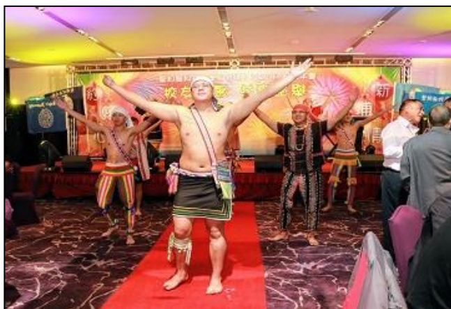
由原住民學生組成的原創文化社應邀現場表演，超水準的演出，獲得滿堂喝采。