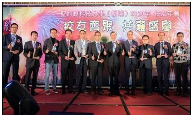
活動特別安排 10 位傑出校友當選人走星光大道上台領獎，盼成為學弟妹追隨仿效的標竿。