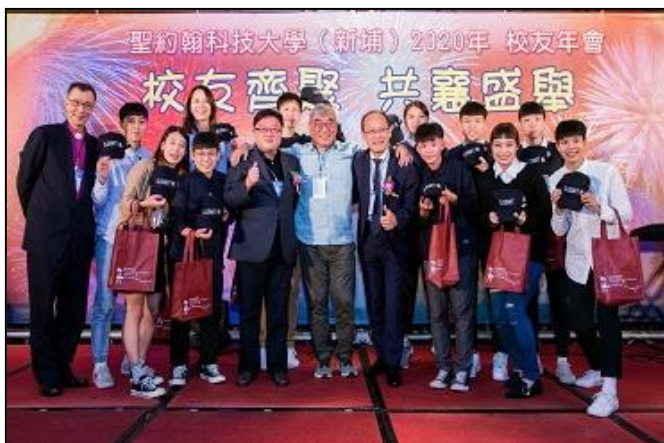
校友總會為聖約翰女籃前進大專盃加油打氣，義賣 12 頂紀念帽籌措經費。