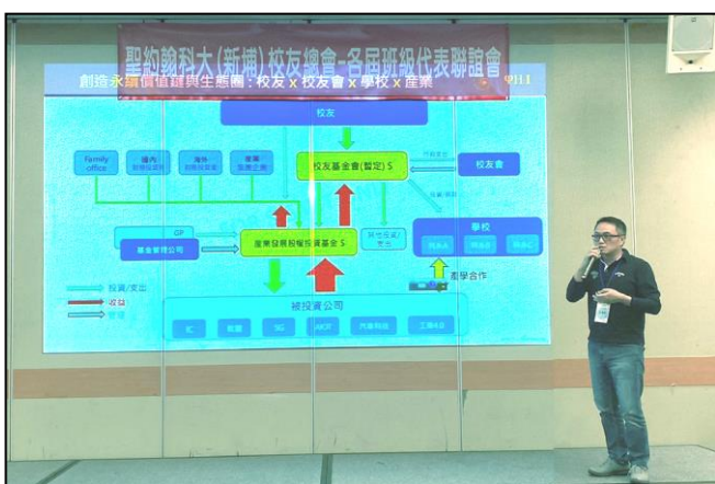
王勇祥學長 ( 73 電子孝 ) 說明私募基金的投資概念，未來願意協助「校友企業」永續經營，壯大校友總會、回饋學校！