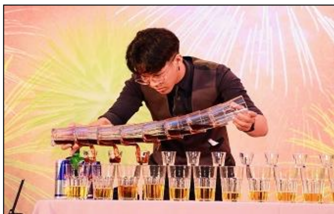
校友總會邀請學生社團現場表演，實際鼓勵及幫助學生社團茁壯成長，圖為調酒社的調酒表演。