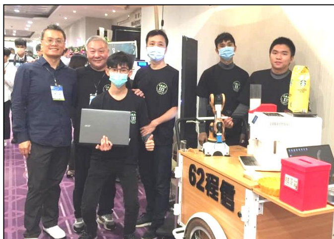
本校工管系將機器手臂沖泡咖機與製作冰淇淋設備設置於會場，提供解說並讓校友們使用。